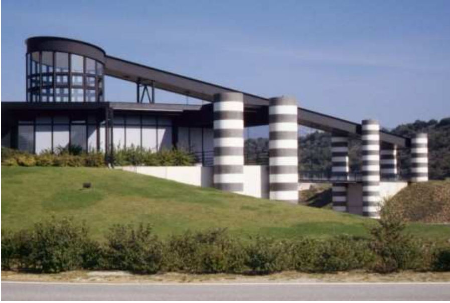
Vue du bâtiment d'accueil